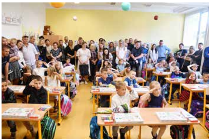
Do třídy prvňáků ze ZŠ Krestova zavítali také jejich rodiče.

Dějepis, tělocvik a zeměpis mě bavily opravdu hodně. Hudebka taky, a ano všechno zmíněné mě dodnes těší. Co mi nešlo a vůbec mě nebavilo, byla chemie na střední škole. To ale bylo dáno hlavně náročností. Chodil jsem na gympl, jehož součástí byla chemická průmyslovka. My humanitní gymnazisté (smích) jsme to pak dostávali sežrat od zkušených kantorů průmyslových oborů.