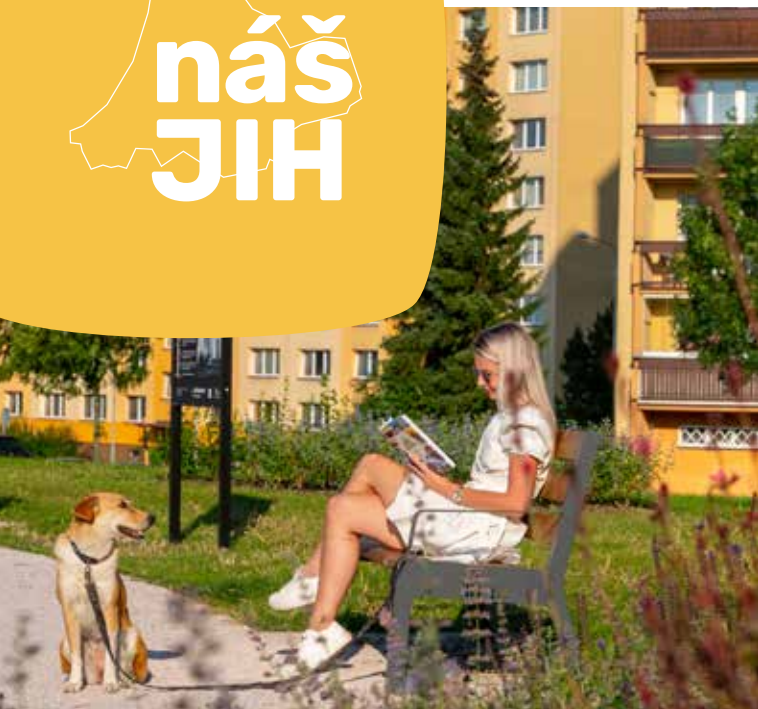
Park u smyčky tramvají lze využít k odpočinku.