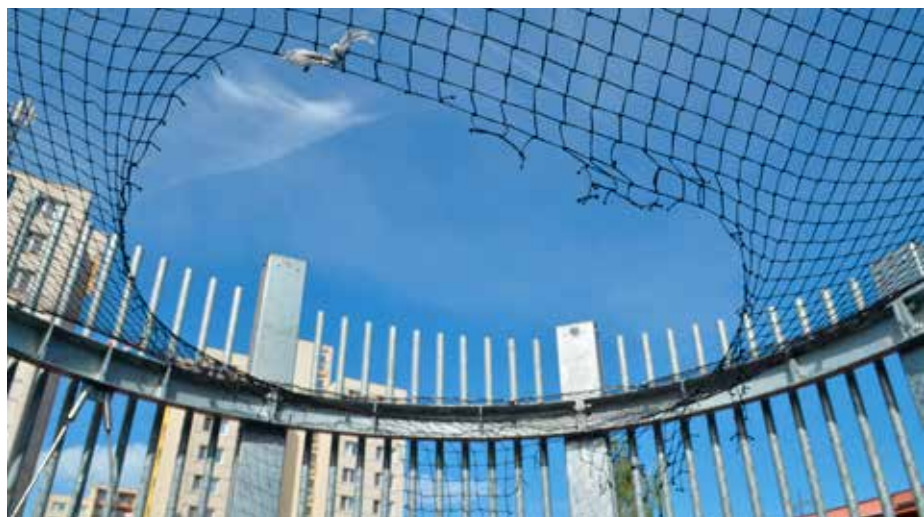
Útokům ničemů neunikají ani ochranné sítě na dětských hřištích.

Stále jsou mezi námi takoví, kteří si neváží práce druhých a nechtějí pochopit, že veřejný prostor slouží všem. Nevšímavost k takovému chování se rozhodně nevyplácí. Opravy jsou totiž financovány z veřejných prostředků. Chová-li se kdokoli nežádoucím způsobem, je vhodné jej na to upozornit, případně neprodleně kontaktovat Městskou policii Ostrava na telefonní lince 156.