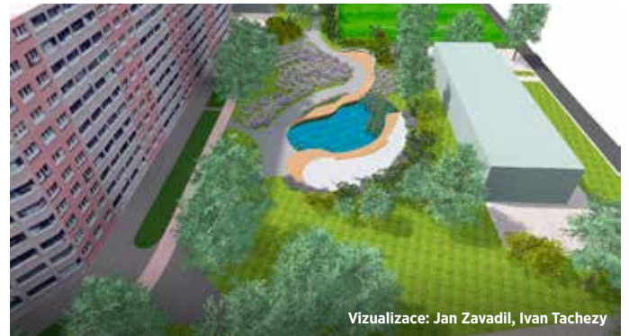
Vizualizace: Jan Zavadil, Ivan Tachezy

V novém městském sadu vysázeny téměř tři desítky stromů, tři desítky keřů, vodní rostliny, založeny budou trvalkové záhony a nový trávník. Pobytový prostor doplní parkové cesty a nové osvětlení.