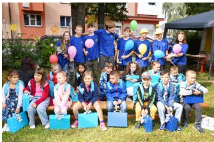
Prvňáky ze ZŠ Březinova doprovázeli jejich starší spolužáci.