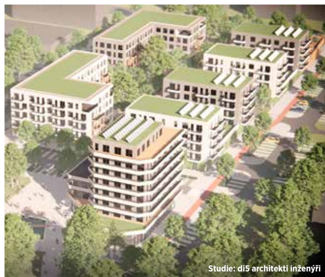
Studie: d15 architekti inženýři

Výstavba rezidenční čtvrtě Střeškovská je plánována v několika etapách a zahájena by měla být v roce 2027.