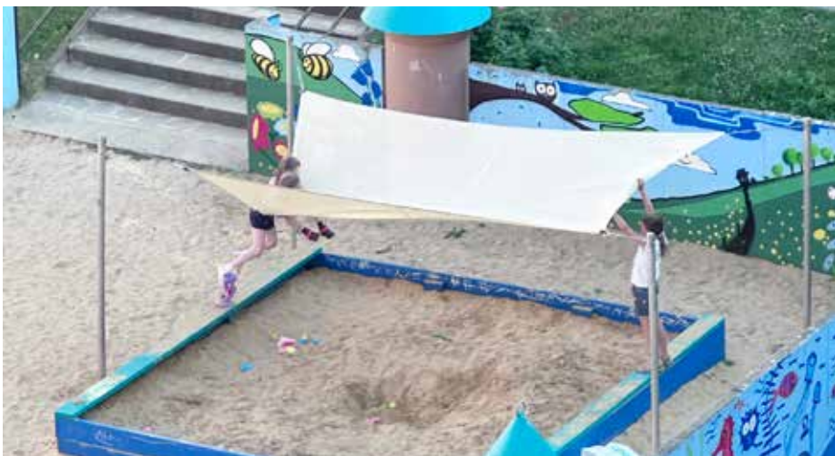
Takhle opravdu ne! Krycí plachty nejsou houpací sítě.

Pořád si nedají pokoj a jejich chování výrazně zatěžuje kasu radnice. A nejde o zanedbatelné částky, které by se daly přehlížet. Řeč je o individuích, která navštěvují sportovní areály v obvodě a rozhodně tam nechtějí smysluplně trávit vlastní volný čas. Spíše se snižují k tomu, že demolují tato veřejná místa.